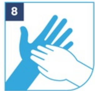
8 Uñas frente a palma