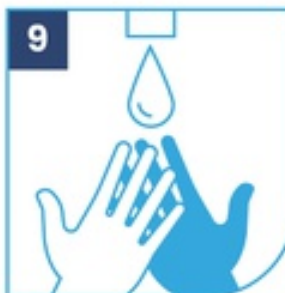
9 Aclara tus manos