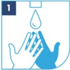
1 Humedece tus manos

El lavado de manos tiene que durar mínimo 20 segundos.