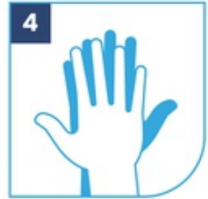
4 Palma sobre dorso