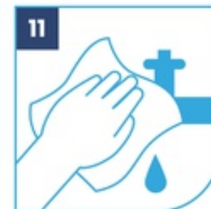
11 Cierra el grifo con el papel