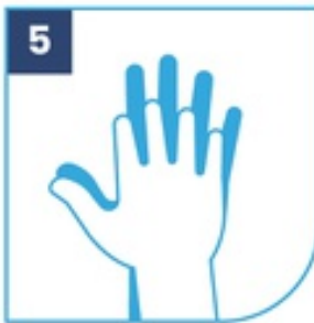
5 Zonas interdigitales