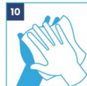
10 Seca tus manos con papel desechable