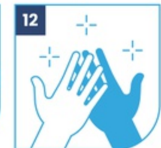
12 Sus manos son seguras