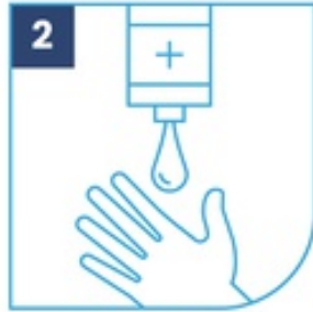
2 Utiliza jabón