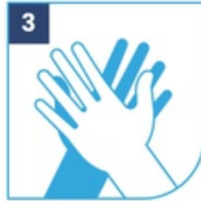
3 Fronta palma contra palma