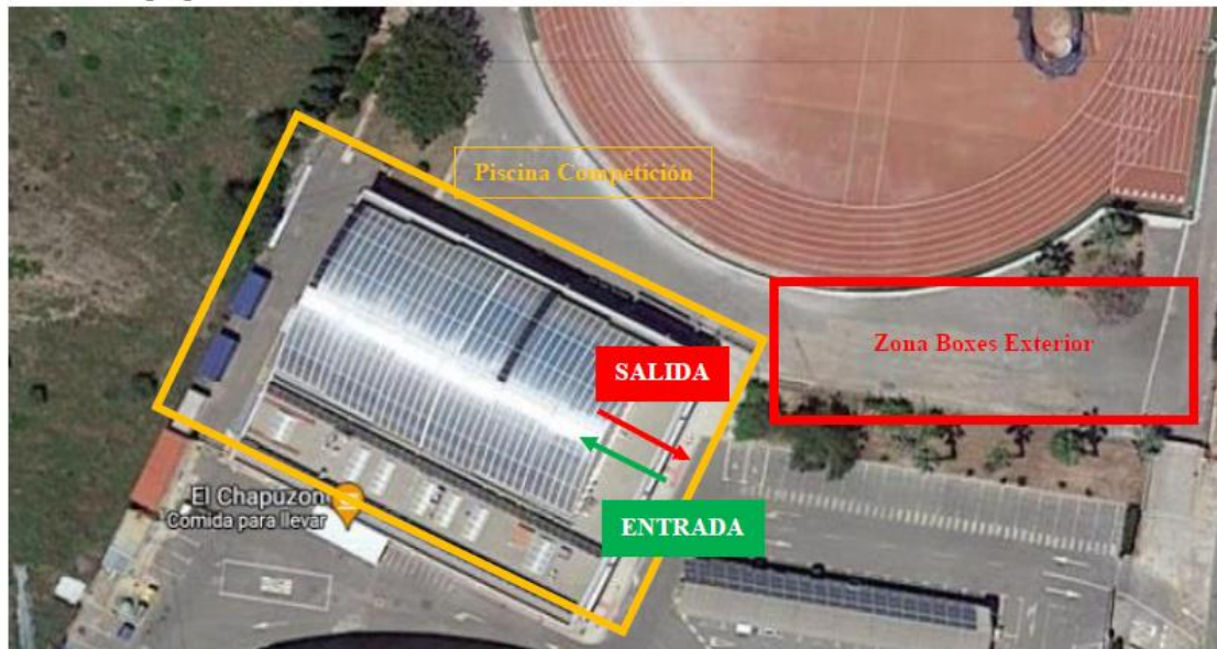
Distribución de accesos y salidas (planta baja):