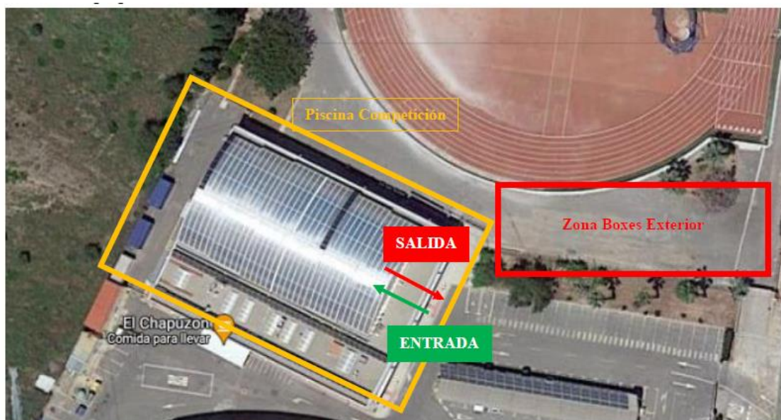
Distribución de accesos y salidas (planta baja):